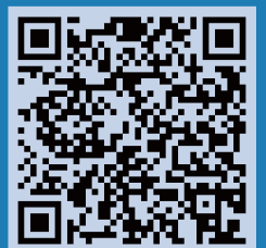
▲テンプレート(illustrator形式)