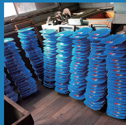
▲ 全ての工程に職人技が詰まった純国産『奉納うちわ』の製作風景