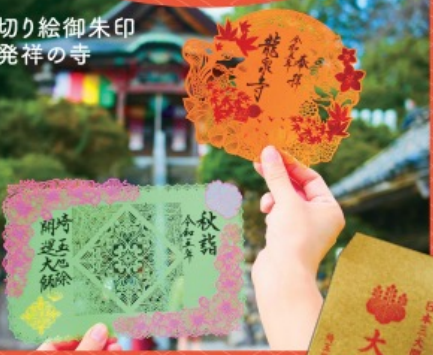
切り絵御朱印 発祥の寺

【主催】熊谷深谷開運コンテンツ協議会 【後援】熊谷市・熊谷市観光協会 深谷市・深谷市観光協会