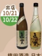
権田酒造 日本酒 「直実」