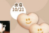
植竹製菓 「実り来る最中」