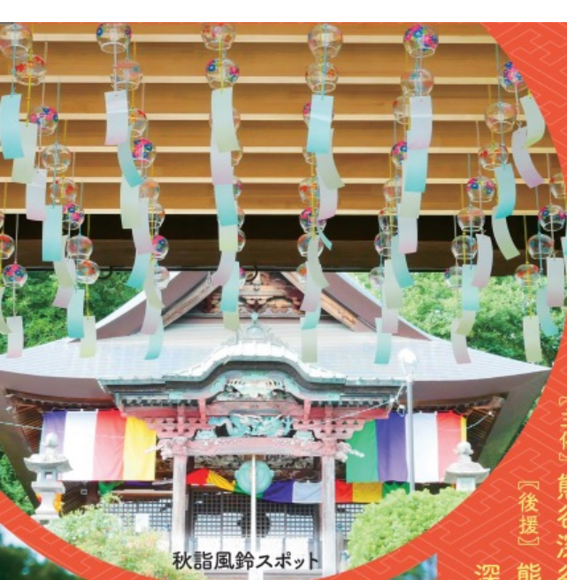
秋詣風鈴スポット