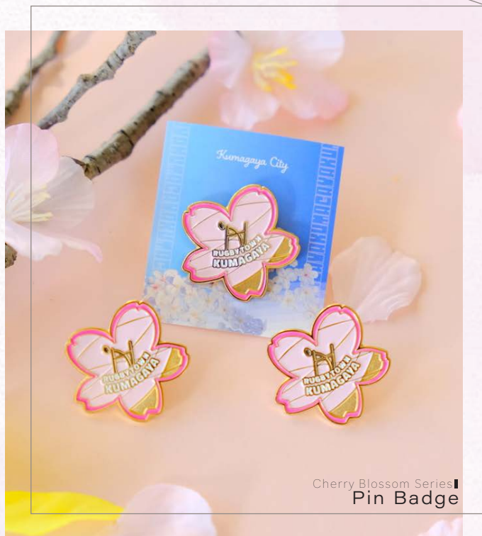
Cherry Blossom Series | Pin Badge