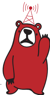
FMクマガヤ マスコットキャラクター ラジクマ