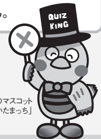
埼玉県のマスコット「さいたまっし」

☎ 048-830-3955 http://www.sainokuni-kanko.jp/ FAX 048-830-4819